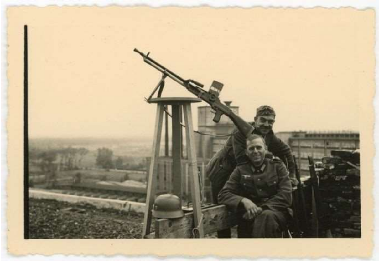
Duitse militairen op een van de gebouwen van Philips op Strijp S. Op de achtergrond het Klokgebouw.

Overigens verbaast het De Waal niet dat het boek er niet kwam. „Sommige van die verslagen zijn saai. Soms wilden ze het niet te persoonlijk of te herkenbaar maken. Daarmee haal je het spannende er uit. En zo'n verhaal interessant opschrijven kan ook niet iedereen.” Verder wijst hij erop dat gemeenten in de naoorlogse jaren niet bezig waren met herdenken. Die hadden in de tijd van de wederopbouw andere zaken aan hun hoofd. „Dat meer uitgebreide herdenken dateert van de jaren tachtig”, zegt hij.