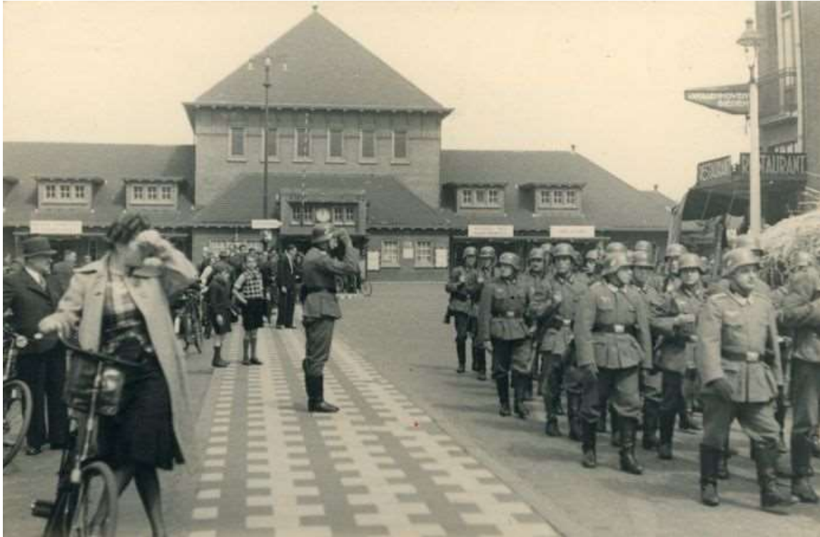
Duitse militairen lopen voor het toenmalige station van Eindhoven.

Er had na de oorlog een gedenkboek van de PAN moeten verschijnen, maar zo ver is het nooit gekomen. De initiatiefnemers hadden de gemeente Eindhoven om een financiële bijdrage gevraagd. De gemeente voelde daar niks voor.