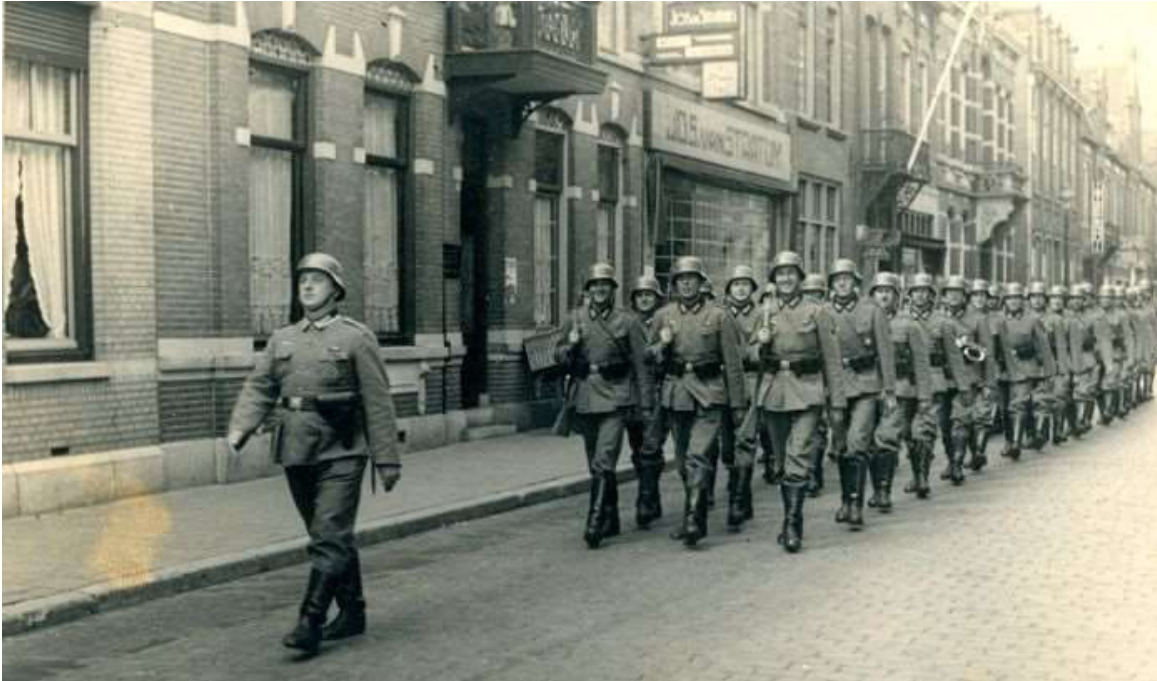
Duitsers marcheren door de Willemstraat in Eindhoven.

Terwijl de man instructies aan het geven was aan zijn manschappen, stond het tweetal op een afstandje bedremmeld mee te luisteren. Toen de commandant ze ineens zag staan en vroeg wat ze daar in hemelsnaam te zoeken hadden, begon een van de twee over het gestolen vlees. „Ga zelf maar kijken of je daders kan vinden”, beet de commandant hem toe.