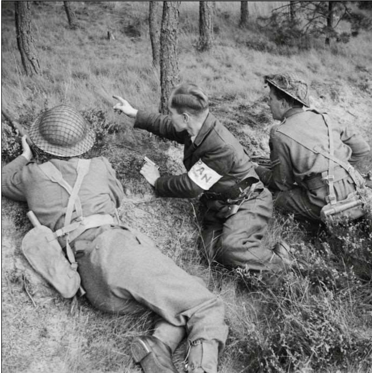
Een PAN-verzetsstrijder helpt Engelse soldaten.

Er is archiefmateriaal van drie PAN-afdelingen: De Kempen, Eindhoven en Geldrop. Vermoedelijk waren er circa 500 partizanen in de regio actief. Nieman en De Waal zijn daarmee aan de slag gegaan. De heemkundekring van Bladel heeft het Kempische verslag op